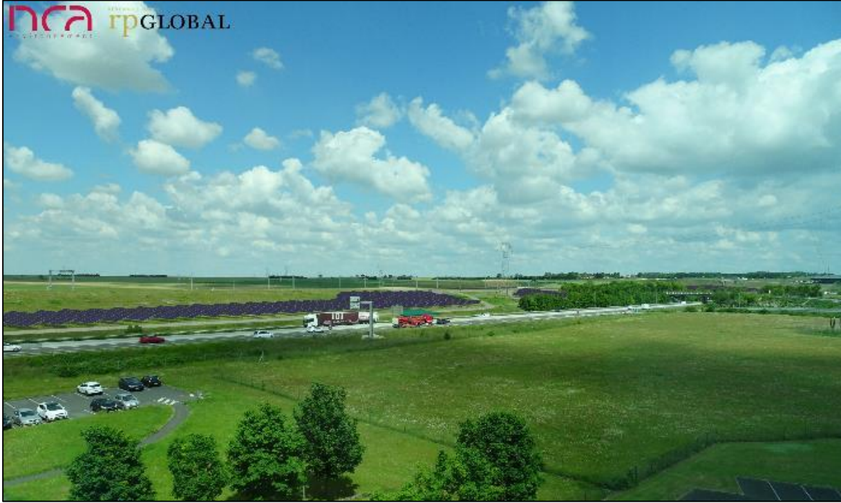
↑ Après construction