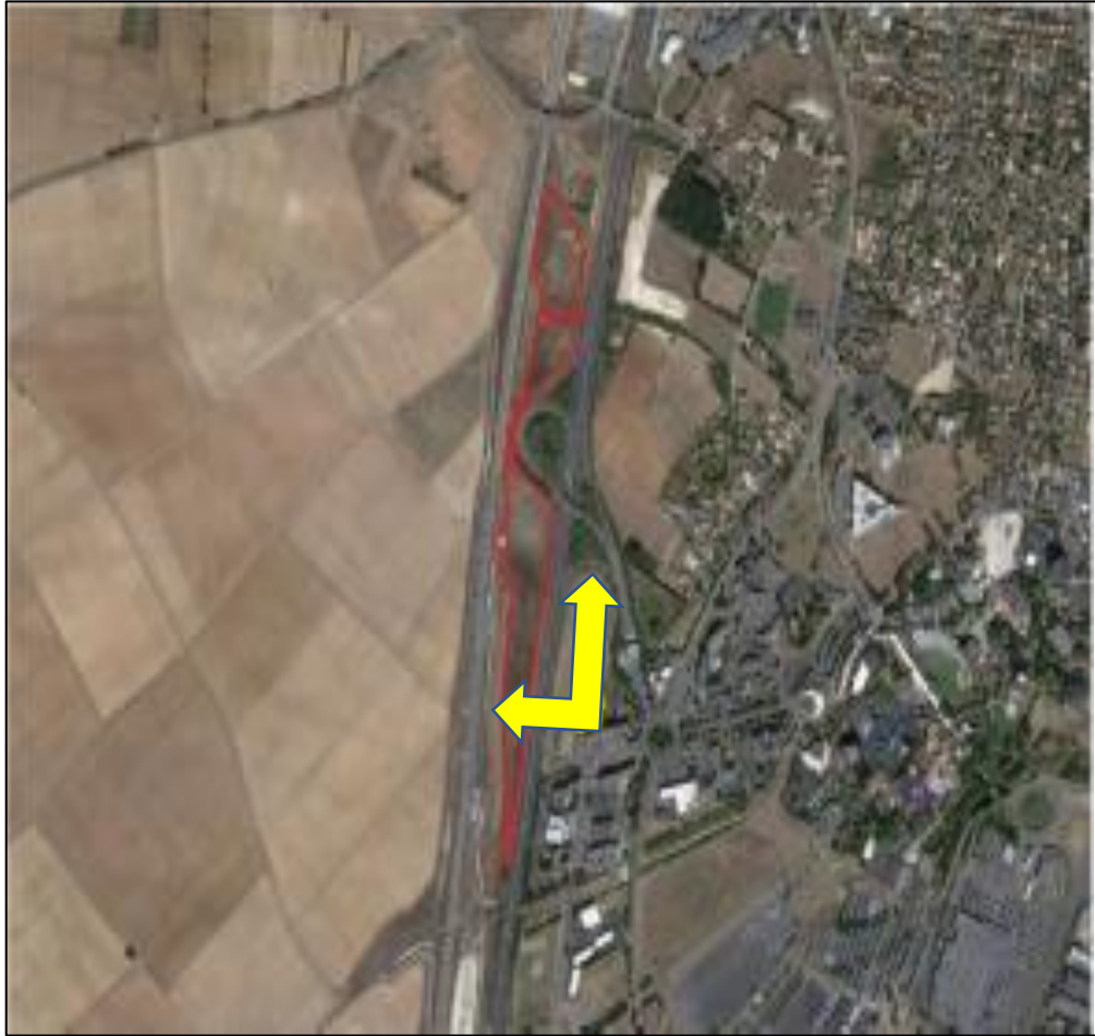
Point de vue