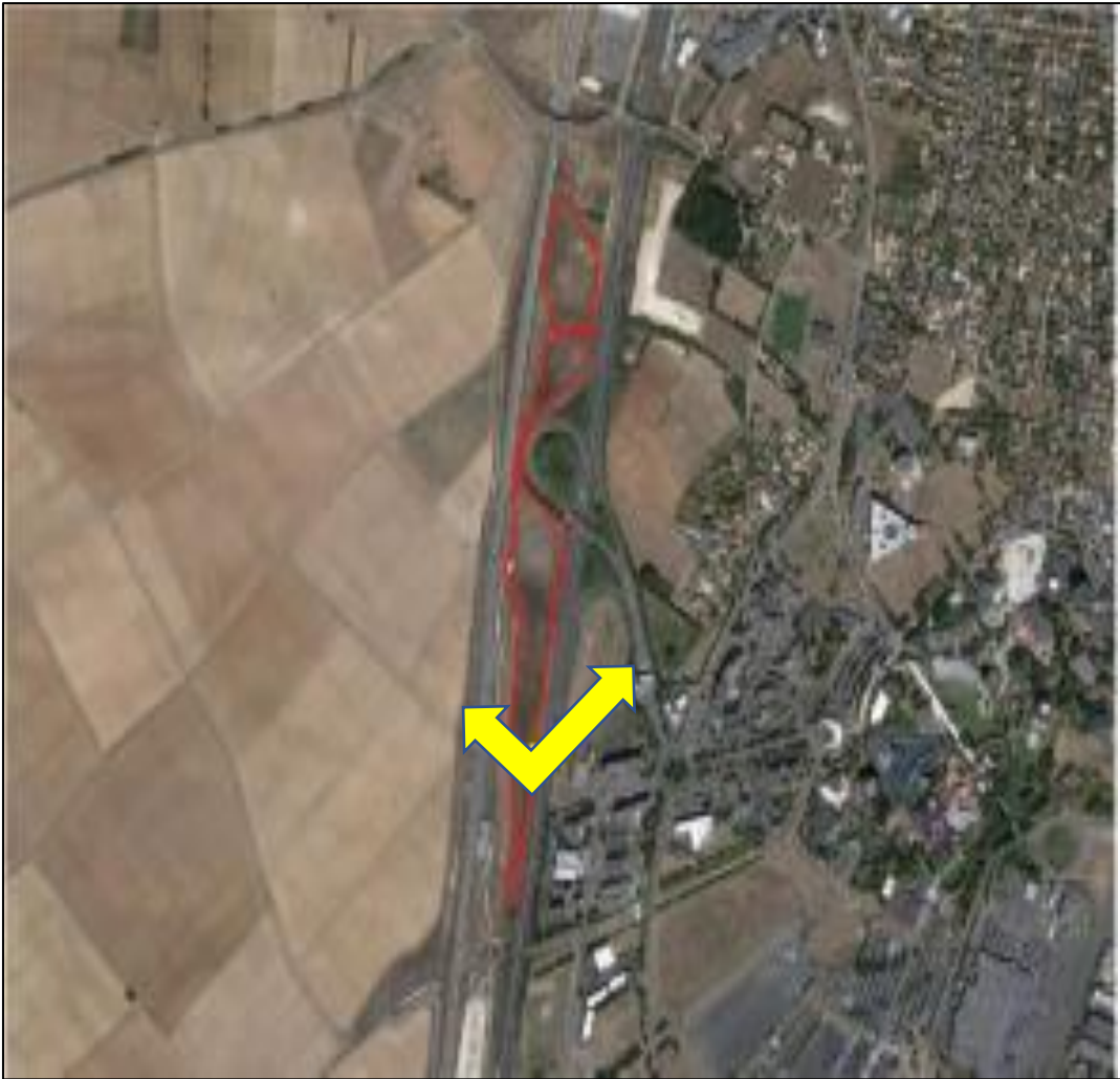
Point de vue