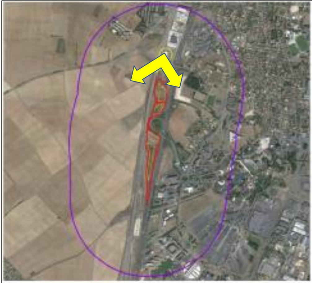
Point de vue